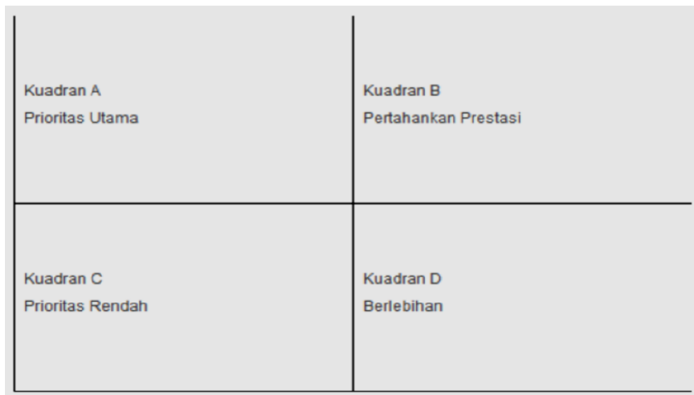
Gambar 1. Empat Kuadran dalam Importance Performance Analysis